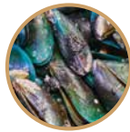
MAŁŻA NOWO- ZELANDZKA

Superfood są pochodzenia naturalnego, dlatego zaliczamy do nich głównie rośliny, a rzadziej mięso i ryby.