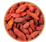
SUSZONA JAGODA GOJI