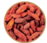
SUSZONA JAGODA GOJI