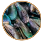
MAŁŻA NOWO- ZELANDZKA

Superfood są pochodzenia naturalnego, dlatego zaliczamy do nich głównie rośliny, a rzadziej mięso i ryby.